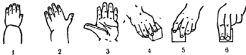
Рис. 3. Этапы развития функций кисти руки ребенка: 1 - положение кисти в 16 недель, 2 и 3 - в 56 недель, 4 - в 60 недель, 5 - в 3 года, 6 - взрослый.

На рис. 3 показано, как совершенствуются движения пальцев рук в процессе развития ребенка. Особое значение имеет период, когда начинается противопоставление большого пальца другим - с этого времени и движения остальных пальцев становятся более свободными.